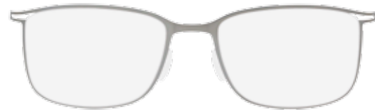
/60-6061 GREY / TOBACCO front and temples ruthenium silky-matte / decoration and temple ends tobacco matte