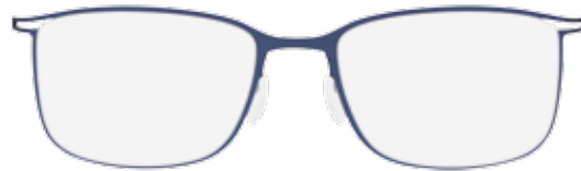
/40-6056 JEANS BLUE front and temples blue grey matte / decoration and temple ends dark blue matte