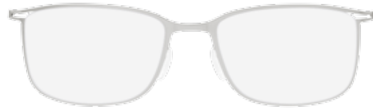
/10-6051 SILVER / BLACK front and temples titanium silky-matte / decoration and temple ends black matte