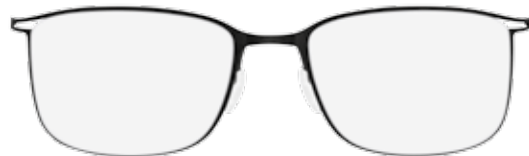
/50-6060 BLACK / ROYAL BLUE front and temples black matte / decoration and temple ends blue matte