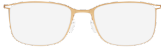
/20-6053 GOLD / BLACK front and temples gold silky-matte / decoration and temple ends black matte