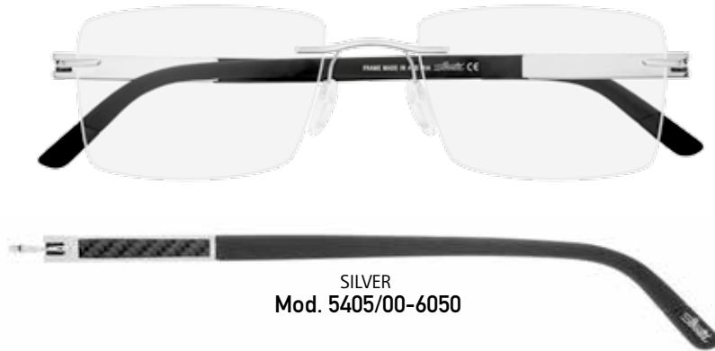
SILVER Mod. 5405/00-6050