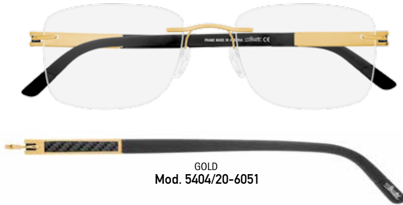
GOLD Mod. 5404/20-6051