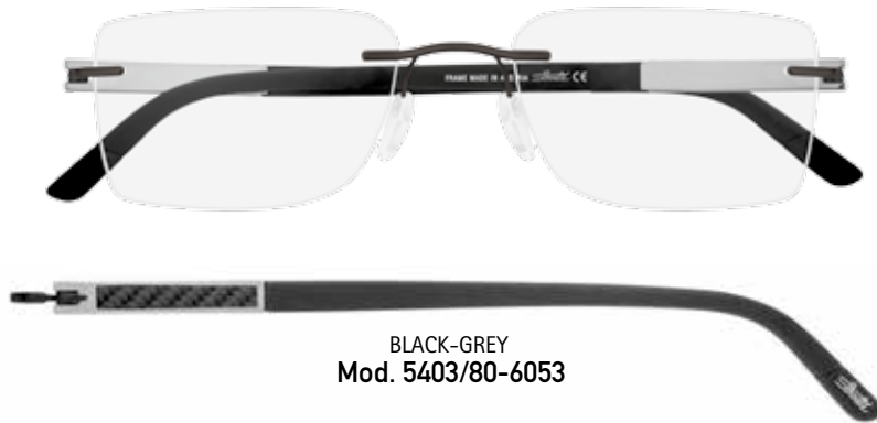
BLACK-GREY Mod. 5403/80-6053