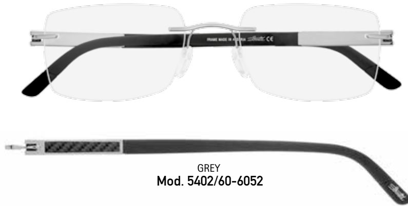
GREY Mod. 5402/60-6052