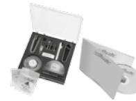
P 0033 Universal-Montage-Box universal mounting-box boîte de montage universelle